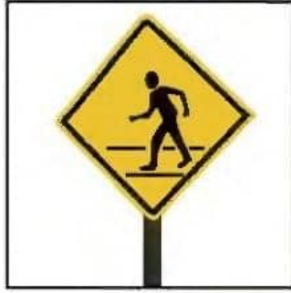
لَا فِتَّةُ عُبُورٍ